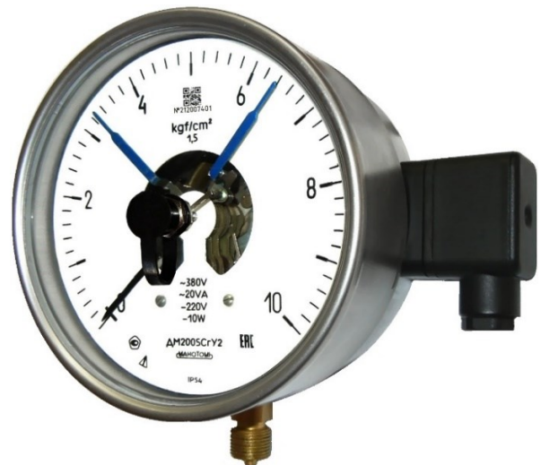
Рисунок 4 – Общий вид манометров DM2005CГ