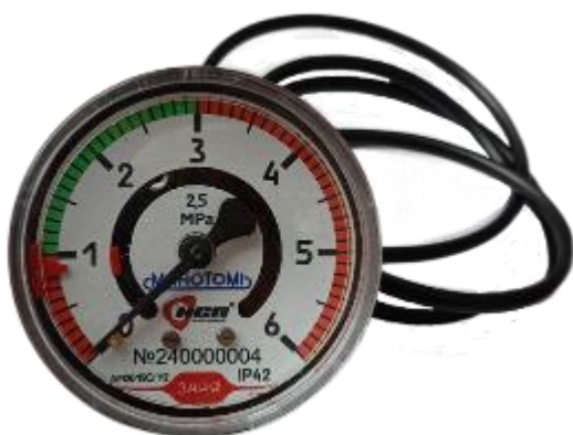
Рисунок 11 – Общий вид манометров ДМ2015Сг