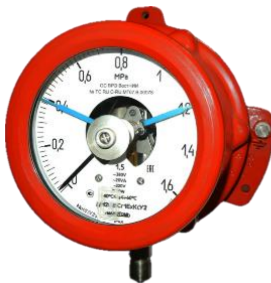
Рисунок 8 – Общий вид манометров ДМ2005Сг1ЕхКс