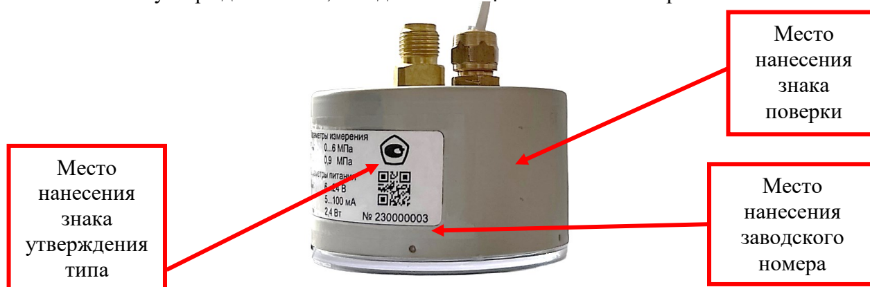
Рисунок 2 – Места нанесения знака поверки на корпус манометра, знака утверждения типа и заводского номера на технической табличке манометра ДМ2015Сг, ДМ5010Сг0Ех, ДМ5012Сг