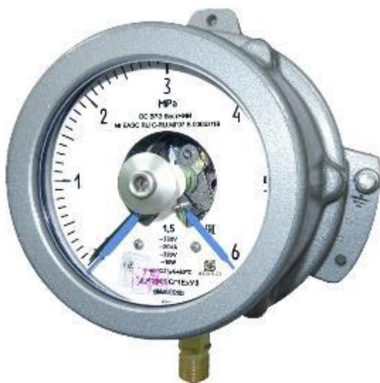
Рисунок 7 – Общий вид манометров ДМ2005Сг1Ех