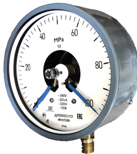
Рисунок 6 – Общий вид манометров DM2005CГ