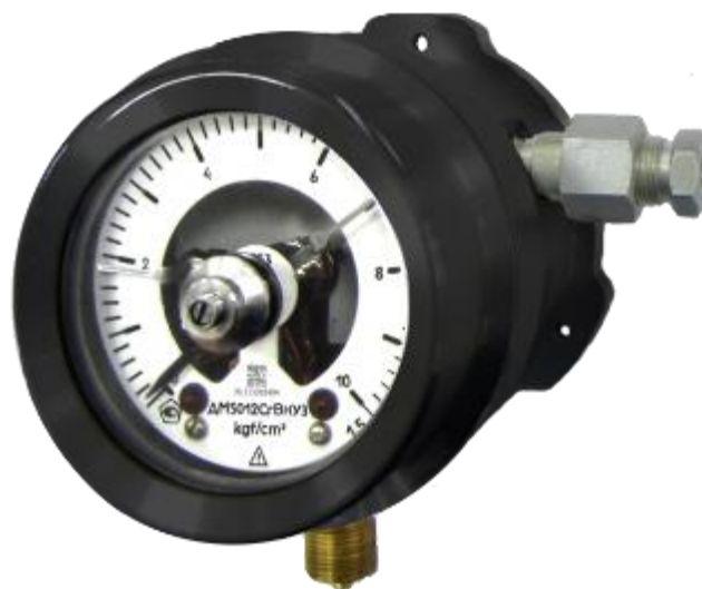
Рисунок 10 – Общий вид манометров ДМ5012СгВн