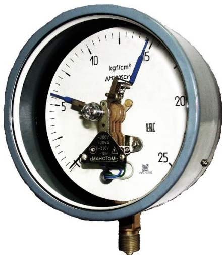
Рисунок 5 – Общий вид манометров DM2005CГ-ЭКМ