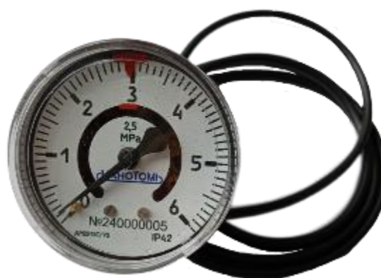
Рисунок 12 – Общий вид манометров ДМ2015Сг