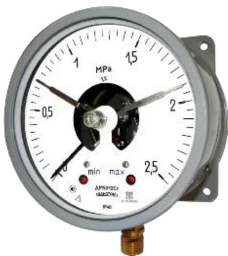
Рисунок 9 – Общий вид манометров ДМ5012Сг