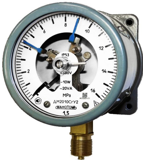
Рисунок 3 – Общий вид манометров DM2010CГ