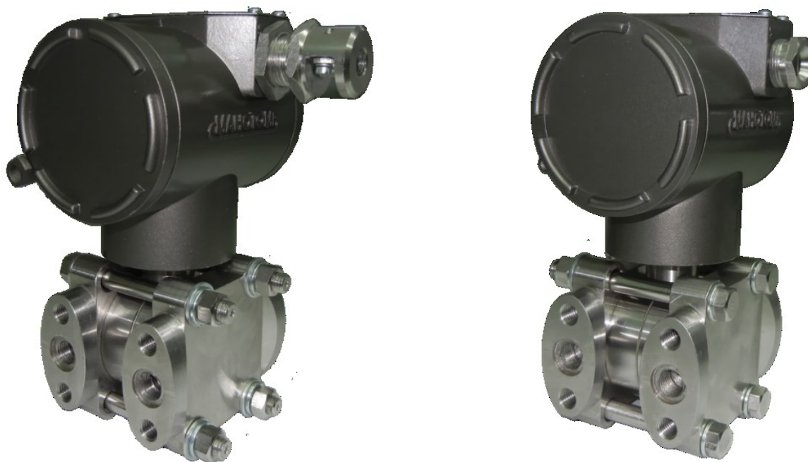
Рисунок 1 – Фотографии общего вида датчиков давления ДМ5017 фланцевого исполнения без индикатора

Фотографии общего вида датчиков приведены на рисунках 1 – 4.