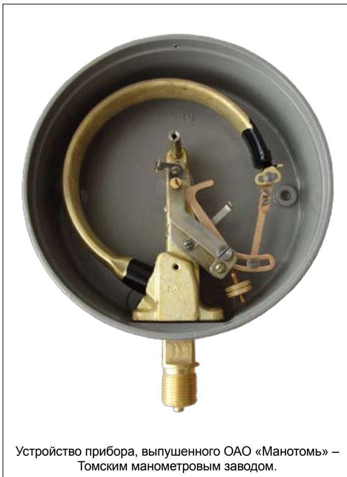
Устройство прибора, выпущенного ОАО «Манотомь» – Томским манометровым заводом.

Как бы актуальны не были эти вопросы, они остаются пока без ответа.